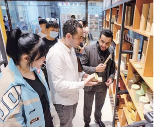
資料圖：外國客商參觀東南亞採購集散中心展館。